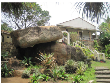
Der Garten vom Ayurveda Garden

Weitere Informationen über den Ayurveda Garden und Ayurveda finden Sie unter: www.ayurveda-garden.de