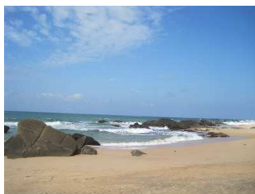
Der Strand vor dem Hotel